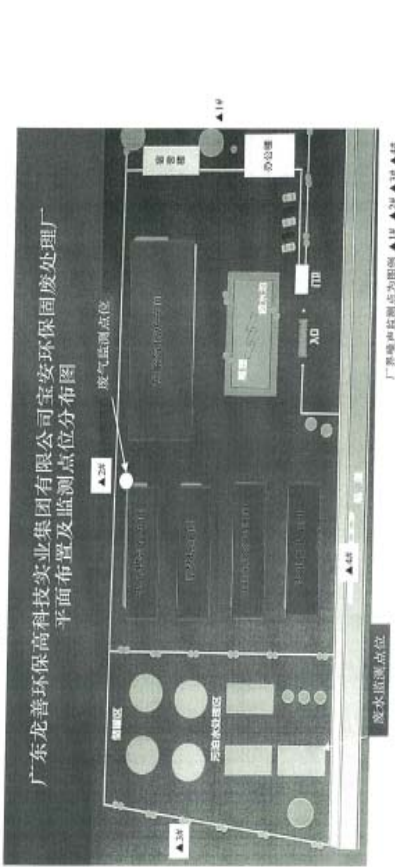
附 D：全厂平面布置及监测点位分布图